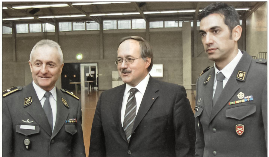
Brigadier Hans-Peter Wüthrich durfte an seinem Rapport Bundesrat Schmid begrüßen. Rechts Oberst i Gst Ennio Scioli, Referent Verteidigung im VBS.

Die Armee muss in den heutigen modernen Bedrohungsfeldern wie Terrorismus, terroristische Bedrohung oder den Auswirkungen der Proliferation erfolgreich sein. Bundesrat Schmid warb für den Entwicklungsschritt 08/11. Mit der geplanten Aufstockung von 16 auf 20 Infanteriebataillone wird ermöglicht, dass permanent während eines Jahres ein solches im WK