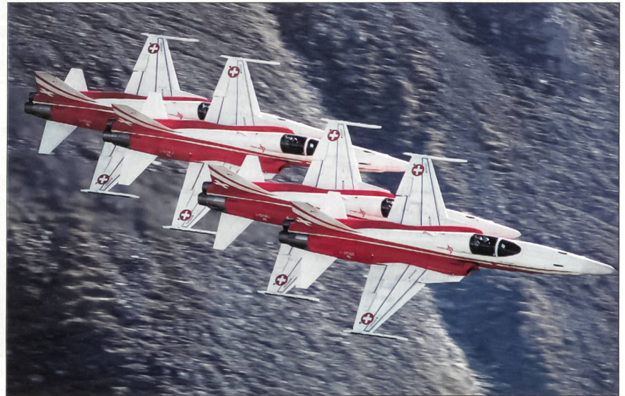
Die Patrouille Suisse soll noch lange auch in den Alpen fliegen können.

Auch Bundesrat Samuel Schmid, der Chef des VBS, wandte sich gegen Webers Vorstoss: «Letztlich geht es darum zu entscheiden, wie weit wir noch eine einsatzfähige Luftwaffe haben wollen. Dass zu unserer Neutralität eine spezielle Befähigung gehört, den Luftpolizeidienst mit Jets wahrzunehmen, dürfte kaum noch lange zu erörtern sein. Wenn wir aber die Trainingsmöglichkeiten im eigenen Land – das nicht eine Topografie aufweist, wie sie sehr viele andere Länder haben – auf eine Weise beschränken wollen, die Echt-einsätze und echte Übungen kaum mehr ermöglicht, der sägt am Ast, an dem das Prinzip der Kampfkraft der Luftwaffe hängt.»