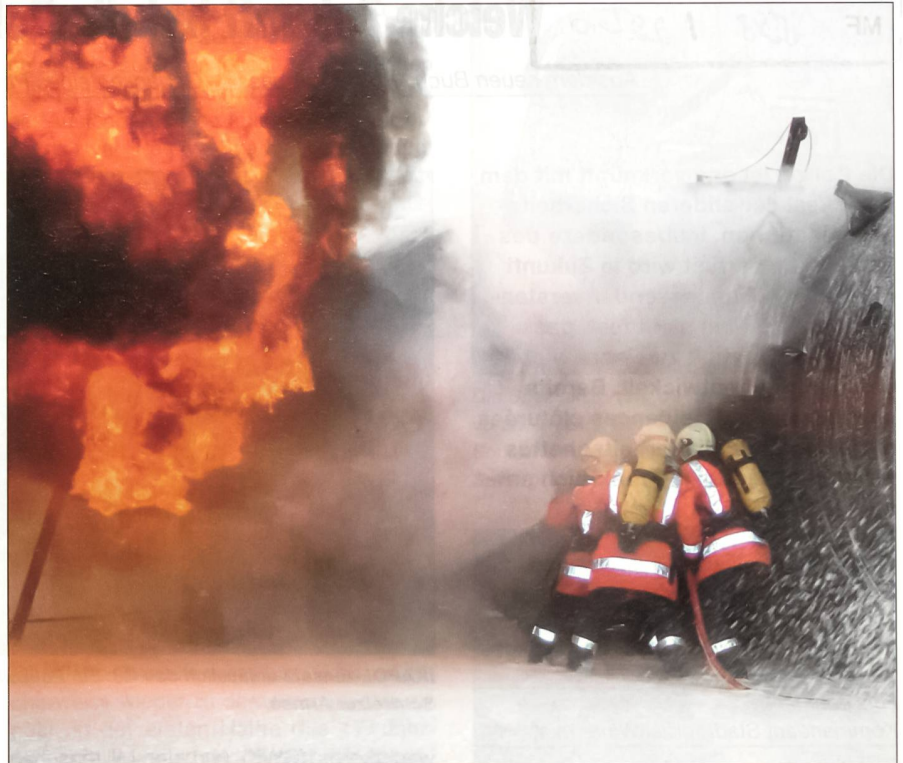
Sicherheit im Brandfall.

Neben der Bewältigung des Schadens steht über die Medien also die Beruhigung der Bevölkerung mit einer ehrlichen Information im Vordergrund, weil diese schnell wieder in den Alltag übergehen will und dies aus psychologischer sowie wirtschaftlicher Sicht sinnvoll und wichtig ist. Realistische Übungen zwischen allen zivilen und militärischen Partnern sind deshalb notwendig, was teilweise schon geschieht, aber noch verbessert bzw. intensiviert werden muss, gerade weil die Schweiz im Sicherheitsbereich eine föderale Struktur aufweist, die im Normalfall effizient und gut ist, in Notfällen aber hinderlich sein kann (unterschiedliche Kommunikationssysteme, Einsatzzentralen zu wenig vernetzt usw.).