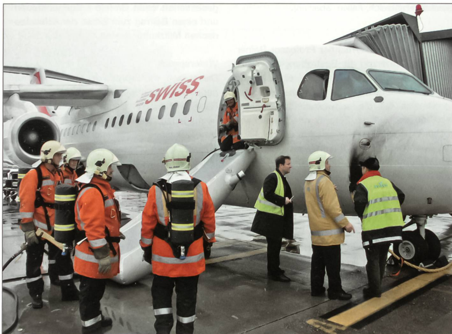
Sicherheit am Flugzeug.

Alle Referenten waren sich einig, dass grundsätzlich die erwähnten Sicherheitsorganisationen gut organisiert sind und ihre Aufgabe erfüllen können, was sich im sehr guten subjektiven Sicherheitsgefühl der Bevölkerung im Kanton Zürich ausdrückt, welches nämlich besser ist als die objektive Lage, wenn man sich die entsprechenden Statistiken vor Augen führt. Der gute Standard rührt auch daher, dass in der Führungsorganisation in den letzten Jahren Fortschritte erzielt und auch gemeinsame Ausbildungen intensiviert worden sind, wobei es hier noch Verbesserungspotenzial gibt. Herausforderungen wie eine Pandemie, wenn die sowieso in der Schweiz immer knapp bemessenen Sicherheitskräfte reduziert sein werden,