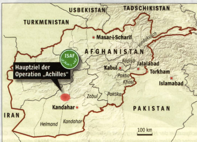
Die Operation der NATO in Südafghanistan.