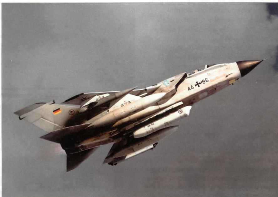
Tornado der Bundeswehr mit RECCE-Pod für die strategische Aufklärung.

Die Bundeswehr wird die sechs Aufklärer auf dem Stützpunkt Masar-i-Sharif im Norden von Afghanistan stationieren. Die Tornado-Maschinen werden im April auf den dortigen Flugplatz überführt. Es ist vorgesehen,