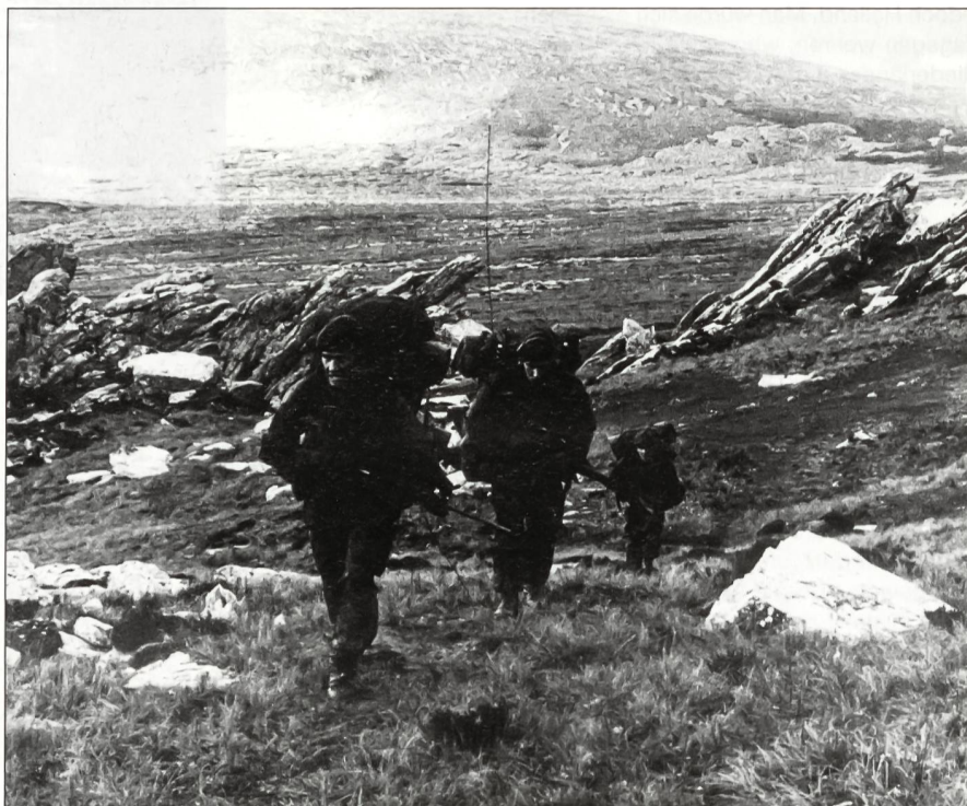
Angehörige der 3 Commandos (Royal Marines) kämpfen sich vor.

Die Falklandinseln standen dabei im Vordergrund. In der Folge wurden die Signale der argentinischen wie der britischen Seite von der Gegenseite teils falsch interpretiert. So wurde die indirekte Androhung einer Invasion durch die Argentinier vor der UNO von den Briten übersehen, was die