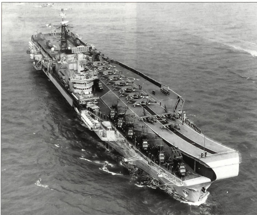
Die HMS Hermes verlässt am 5. April 1982 Portsmouth, England, um Kurs auf die Falklands zu nehmen.

Die Gefechte auf dem Vormarsch nach Port Stanley waren oft heftig und stellten angesichts der Kälte und der grossen Nässe höchste physische, aber auch psychi-