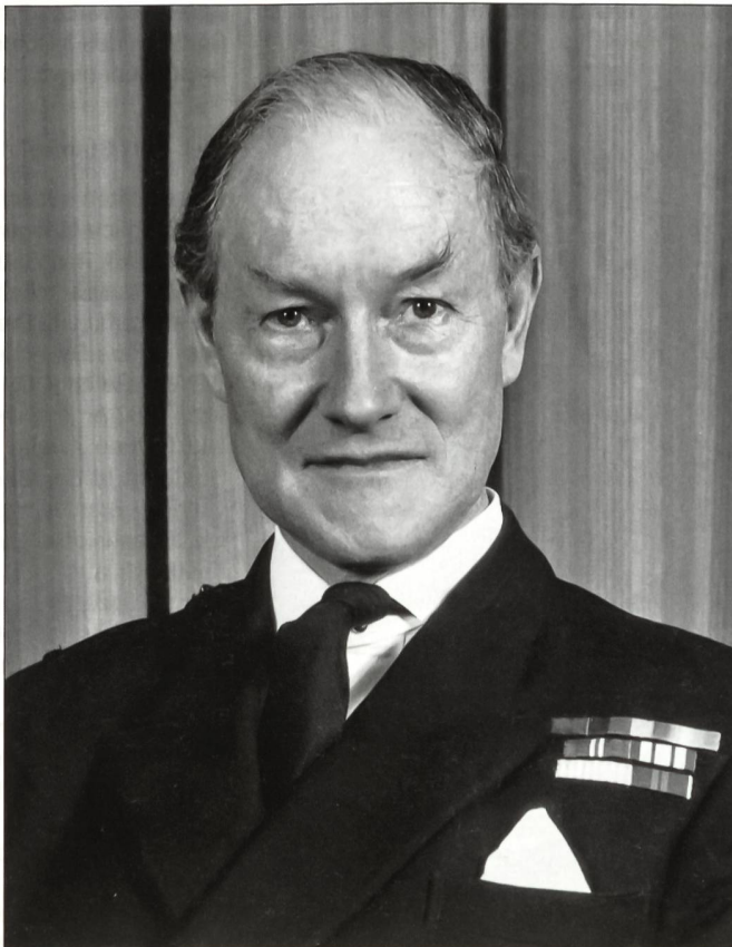
Admiral Sir Henry Leach, der höchste Offizier der Royal Navy, war massgeblich für den Feldzug zur Rückeroberung der Falklandinseln verantwortlich.

Glücklicherweise konnten diese Maschinen nach Ankunft im Südatlantik rechtzeitig auf die Flugzeugträger überflogen werden, bevor das Schiff dort versenkt wurde. Auch andere zivile Schiffe, darunter die berühmte Queen Elizabeth II mit drei Bataillonen der 5. Infanteriebrigade an Bord (inkl. des 2. Para Bat) und die Uganda (als Lazarettschiff) waren requiriert worden. Insgesamt fuhr die britische Armada mit