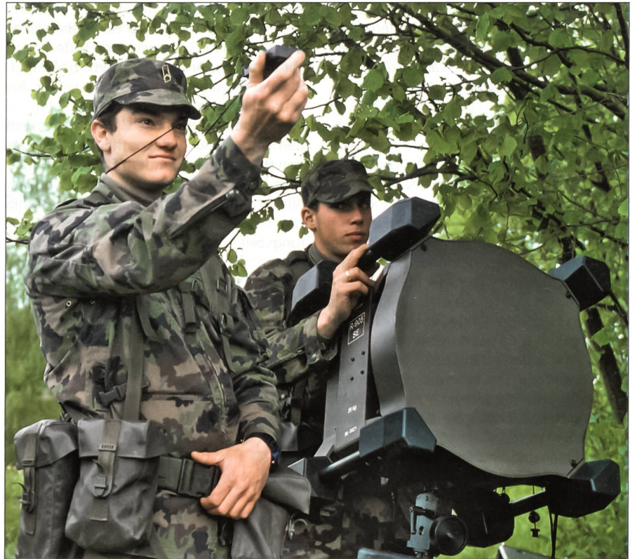
Zwei Spezialisten der Übermittlungstruppen beim Einrichten des Richtstrahlensystems R-905 im Gelände.

Das Führungsinformationssystem Heer ist Teil der «vernetzten Operationsführung». Es dient der Vernetzung von Aufklärungs-, Führungs- und Einsatzmitteln der Armee. Das Führungsinformationssystem Heer