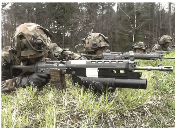
Vertraut mit dem eigenen Gewehr.

Wie Ständerat Hermann Bürgi, der Kommissionspräsident, vor den Medien ausführte, sei der Amoklauf eines Mannes in Baden in die Diskussion eingeflossen. Die Ereignisse der letzten Monate hätten aber nicht den Ausschlag gegeben. sik.