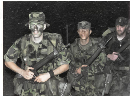
Ankunft der angehenden Commandos nach dem 15-km-Selektionsmarsch.

Nach dem Selektionstag sind die ersten beiden Kurswochen der Eintrittsübung sowie der Grund- und Gefechtsausbildung gewidmet. Sie umfassen Aufklärung, Beobachten, Orientierung im Gelände, In-/Exfiltration, Combatschiessen, Übermittlung,