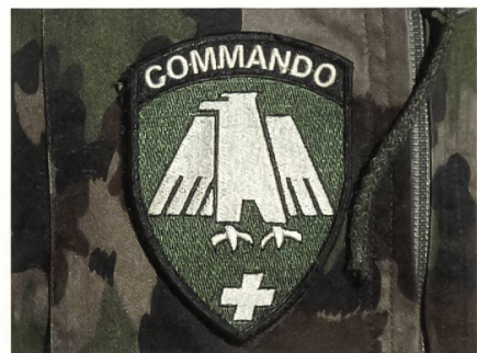
Das begehrte Commando-Abzeichen. Nur die Besten dürfen es tragen.