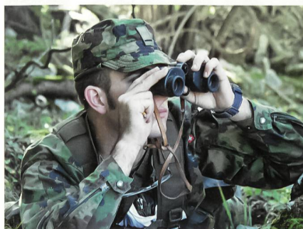
Eine gute Beobachtungsgabe der angehenden Commandos ist wichtig.