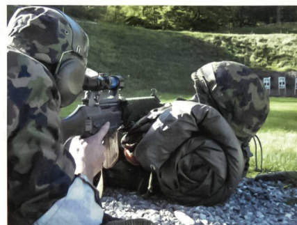
Auch das Schiessen mit dem Zielfernrohr wird trainiert.

Seil- und Übersetztechnik. Die ganze dritte Woche steht im Zeichen der grossen Schlussübung im Tessin.