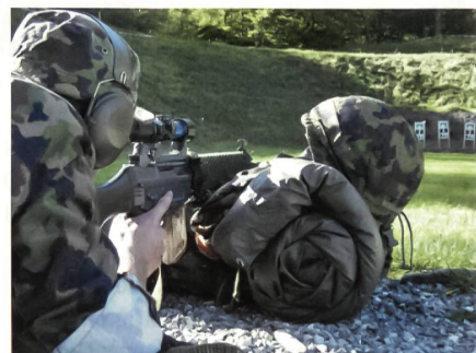
Auch das Schiessen mit dem Zielfernrohr wird trainiert.

Seil- und Übersetztechnik. Die ganze dritte Woche steht im Zeichen der grossen Schlussübung im Tessin.