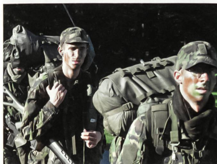
Während der dreiwöchigen Ausbildung sind viele Märsche zu bewältigen.

«Wir prüfen die Leute auch, ob sie zu uns passen, wir suchen keine Rambos und Helden!», stellt der Kurskommandant klar. Im Gegenteil: Die Kursteilnehmer – Soldaten aller Grade – müssen teamfähig sein, über eine gute Kondition und Ausdauer verfügen sowie hohe psychische und physische Belastungen ertragen können. «Denn», so Züger, «uns sind gut funktionierende Teams sehr wichtig, darauf achten wir sehr genau!»