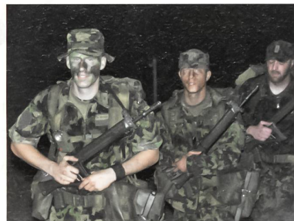
Ankunft der angehenden Commandos nach dem 15-km-Selektionsmarsch.

Nach dem Selektionstag sind die ersten beiden Kurswochen der Eintrittsübung sowie der Grund- und Gefechtsausbildung gewidmet. Sie umfassen Aufklärung, Beobachten, Orientierung im Gelände, In-/Exfiltration, Combatschiessen, Übermittlung,