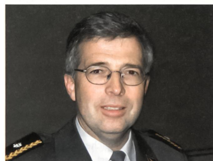
Brigadier Erwin Dahinden.

C-802-Rakete iranischer Herkunft. Der Volltreffer auf die Hanit belegt, dass auch Guerilla-Kräfte moderne Boden-See-Geschosse ins Treffen führen können.