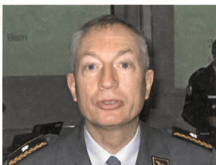
Brigadier Charles Pfister.

Die Hisbollah griff die Korvette an, als deren Besatzung das Abwehrsystem ausgeschaltet hatte. Zum Einsatz gelangte eine