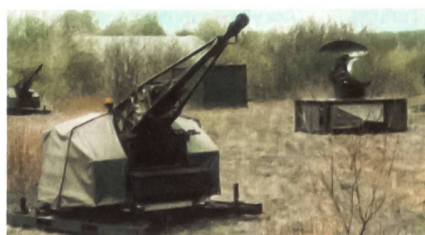
Oerlikon Contraves Skyshield.

Der Rüstungskonzern Lockheed Martin hat das Fliegerabwehrsystem Skyshield 35 mm AHEAD (Advanced Hit Efficiency And Destruction) des Herstellers Oerlikon Contra-