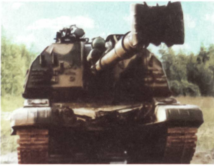
2S19SP mit Kanone im NATO-Kaliber 155 mm.

Um weitere Kunden auf dem Exportmarkt hinzugewinnen zu können, wurde kürzlich eine neue Version der Panzerhaubitze 2S19 SP mit einer Bewaffnung im NATO-Kaliber 155 mm vorgestellt. Die neue 155-mm-Ka-