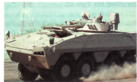
AMV mit BMP-3-Turm.

Die Vereinigten Arabischen Emirate erwägen den Kauf gepanzelter Radfahrzeuge des Typs AMV 8x8 des finnischen Herstellers Patria, welche mit dem Turm des Kampfgeschützenpanzers BMP-3 ausgerüstet werden sollen.