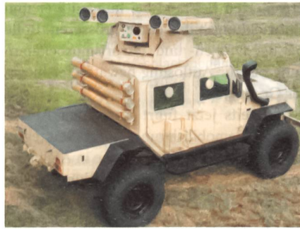
RG-32M mit ALRRT.

Der südafrikanische Rüstungskonzern Denel hat kürzlich ein neues Aufklärungsfahrzeug mit der Möglichkeit zur Panzerbekämpfung vorgestellt. Hierbei wurde die moderne Waffenstation Armed Long-Range Reconnaissance Turret (ALRRT) in das minengeschützte Geländefahrzeug RG-32M des Herstellers BAE integriert.