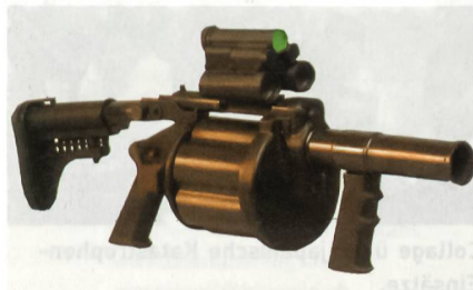
Rippel XRLG 40.

Konventionelle Geschosse mit einer Mündungsgeschwindigkeit von 76 m/s können bis zu 400 m verschossen werden,