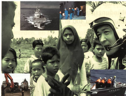
Collage über japanische Katastropheneinsätze.

Abe erklärte, dass das neue japanische Verteidigungsministerium, welches seit Januar einsatzbereit sei, die «Japan Defence Agency» ersetzt habe. Damit könne man nun den Verpflichtungen bei der Friedens-Zusammenarbeit neben der nationalen Verteidigung hohe Priorität