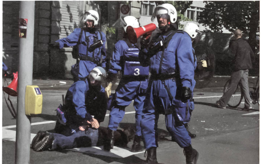
Ein Chaot wird festgenommen. Der Einsatzleiter fordert die Gaffer auf, den Platz zu verlassen.

Einige Minuten später war der Spuk vorbei, die Demonstranten zogen sich auf das Kanzleiareal zurück. Offenbar wurde nun über das weitere «Vorgehen» beraten. In der Zwischenzeit grenzte die Polizei durch ihre Präsenz das Gebiet ein und verhinderte dadurch einen Durchbruch der