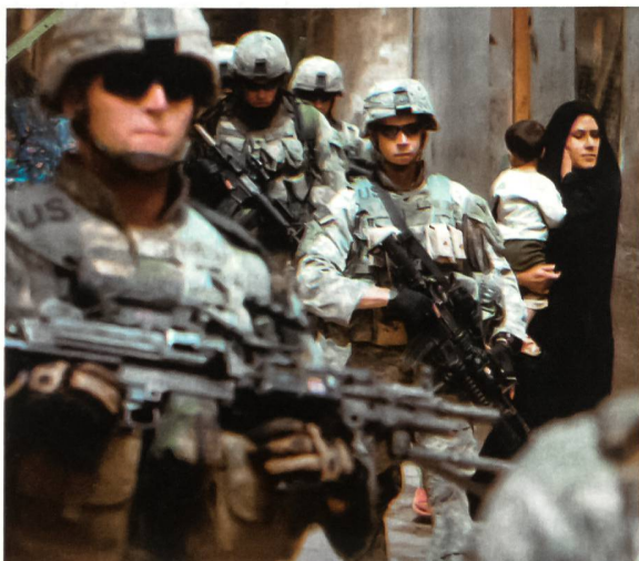
Trennmauer in Bagdad.

Bilden Sie möglichst viele Soldaten aus, die Erste Hilfe leisten können. Bestellen Sie genügend Erste-Hilfe-Notkästen, auch wenn das nicht so im Reglement steht. Kaufen Sie die Kästen notfalls in einem zivilen Laden – ein Kasten kostet 25 Dollar. Viele Händler akzeptieren die Kreditkarten unserer Regierung. Der Buchhalter, der Ihnen sagt, das sei zu teuer, soll einmal dabei sein, wenn das verzweifelte Suchen nach der nicht vorhandenen Erste-Hilfe-Kiste einsetzt. Er müsste es nur ein einziges Mal erlebt haben, was dann fehlt. Dann würde er von selbst verstehen, was ich meine. Im Irak gibt es keine Etappe; der Buchhalter könnte sich nirgends ausruhen.