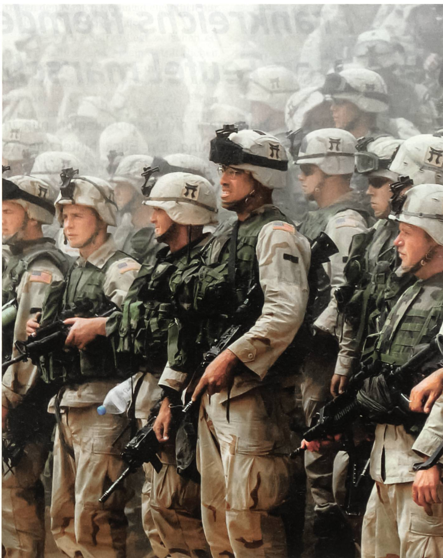
Amerikanische Soldaten im Irak.

Wenn einer Ihrer Soldaten schon zuhause in den USA Eheprobleme hat, dann