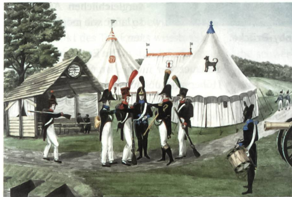
Lagerszene mit Schaffhauser Milizen von H. W. Harder (1810–1872), Museum zu Allerheiligen, Schaffhausen.

Die politische und militärische Lage war um 1800, unmittelbar nach der Besetzung der Schweiz durch Napoleons Frankreich (1798), alles andere als leicht und rosig. Auch im Kanton Schaffhausen war die Lage nach dem Zusammenbruch von 1798 schwierig und unsicher. Schaffhausen war zum Schlachtfeld französischer, österreichischer und russischer Truppen geworden.