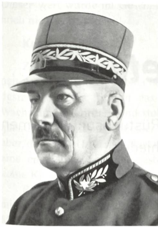
Heinrich Roost (1872–1936)