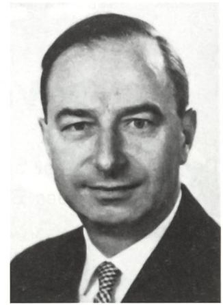
Hermann Wanner (1914–1999)

fiziersvereine unmittelbar Einfluss auf den Kanton und die Bevölkerung nehmen. Diese Chance wurde dann auch in die Tat umgesetzt. Es ist nicht zuletzt das grosse Verdienst des Offiziersvereins, dass die neue Kaserne (die alte befand sich im heutigen Regierungsgebäude mitten in der Stadt) und der Waffenplatz auf der Breite realisiert werden konnten. Ausbildung und Ausrüstung wurden verbessert. Die Gebäude dienen heute als kantonales Zeughaus.