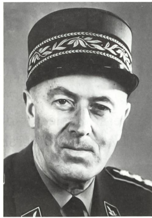
Ernst Uhlmann (1902–1981)