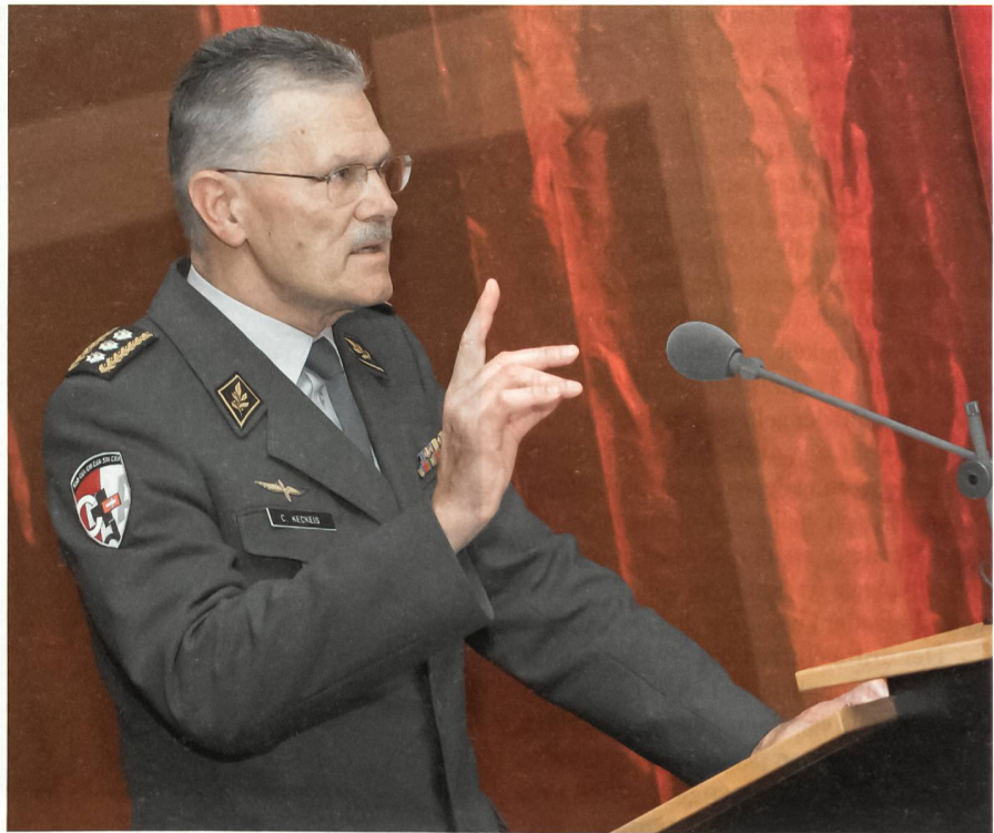
Der Chef der Armee betont die Bedeutung von Standards und Benchmarks.

Im Rahmen ihrer Regionalen Militärischen Kooperation unterstützt die Armee diesen Prozess gerade auch über die PfP-Plattform laufend durch Expertise und materielle Unterstützung sowie finanzielle Beiträge zum Beispiel über den NATO/PfP Trust Fund. So hat sie nachhaltig zum Aufbau eines regionalen Kommunikations-Ausbildungszentrums für den Westbalkan in Skopje beigetragen. Weiter beteiligt sie