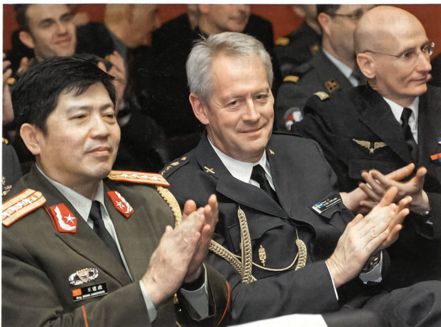
Ausländische Verteidigungsattachés als interessierte Zuhörer.

Als weiteres Mittel zur militärischen Zusammenarbeit hat die Schweiz seit Jah-