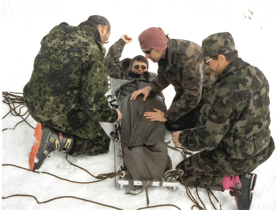
Wintergebirgsausbildung am Kompetenzzentrum Gebirgsdienst der Armee in Andermatt.

werden, weil die Armee vor einem Quantensprung in der PFP-Ausbildung steht. In den ersten zehn Jahren wurden vor allem Individuen ausgebildet und allenfalls als Ad-hoc-Stabsmodule in Übungen geschult. Mit der Teilnahme des Stabes der Inf Br 4 ist nun erstmals eine echte geschlossene Formation im Einsatz. Es gilt also für die Zukunft eine milizverträgliche Dienstregelung einzuführen.