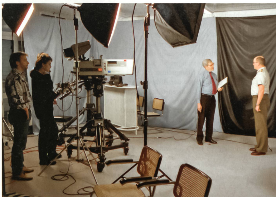
Kommunikationsausbildung am Zentrum Information und Kommunikation Ausbildung der Armee (ZIKA).

Die Armee hat sich einen sehr guten Ruf auf dem Gebiet des Host Nation Supports erarbeitet. Viele Arbeitsgruppen versuchen ihre Seminare und Workshops regelmässig in der Schweiz durchzuführen. Das sichere Umfeld, eine hervorragende Infrastruktur und die Möglichkeit, technisch auf absolutem Top-Niveau arbeiten zu können, machen die Schweiz zu einer gesuchten Adresse. Es verwundert nicht, dass in den letzten Jahren auch vermehrt sehr kompetente Schweizer, Berufsmilitärs wie zivile Verwaltungskader, in diesen Arbeitsgruppen den Vorsitz übernehmen durften. Diesen Vertrauensbeweis gilt es zu bestätigen und die Rolle des aktiven verlässlichen Partners auszubauen. Ebenfalls bietet die Schweizer Armee jedes Jahr viele Kurse an, die sich bei den Partnern grosser Beliebtheit erfreuen. Das motivierende Arbeits- und Lernumfeld in einer intakten Umwelt und vor einer beeindruckenden landschaftlichen Kulisse soll hier nicht verschwiegen werden. Es sind aber auch die technisch hervorragende Infrastruktur und die perfekte Organisation dieser Kurse, welche für die Teilnehmer jede Ausbildung in der Schweiz zu einem Gewinn und Erlebnis machen. Die Angebote müssen jedoch auch weiterhin immer wieder auf ihr Bedürfnis überprüft werden. Die Armee kann es sich nicht leisten, einfach Liebgewonnenes ohne kritische Überprüfung weiterhin durchzuführen. Neben vielen Elementen, die bisher über die Durchführung eines Angebotes entschieden, ist in der Zukunft die Frage