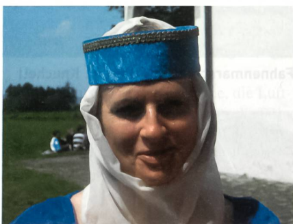
Hofdame aus dem deutschen Hachberg.