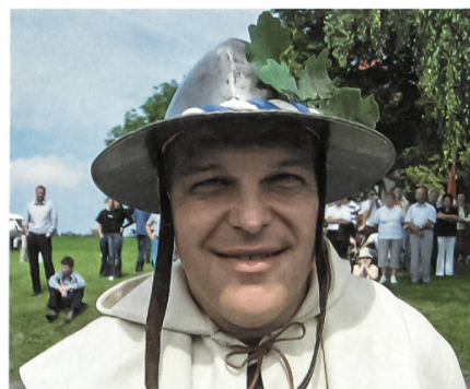
Von der Luzerner Zunft zu Safran.