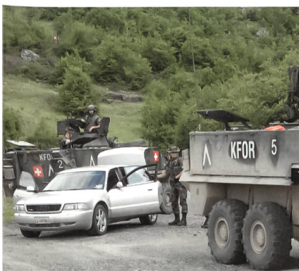
Ein Verdächtiger wird angehalten.