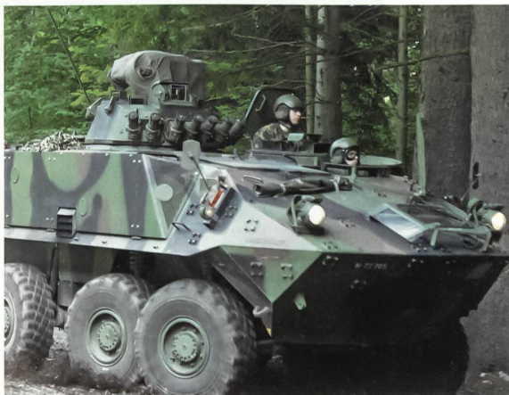
Der Unteroffizier führt im Einsatz.

Nach Abschluss der Kaderausbildung wenden die neu ausgebildeten Kader ihr Wissen im Fortbildungsdienst der Truppe an. Unter dem Titel «Ausbildungs- und Einsatz-