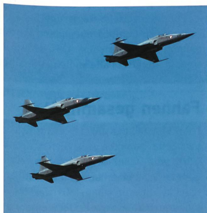
Diese Flugzeuge gilt es zu ersetzen: Tiger F-5, hier als «Österreicher».

Der Bundesrat hat das VBS ermächtigt, mit dem Voranschlag 2008 Verpflichtungskredite in den Bereichen Beschaffungsvorbereitung, Ausrüstung und Erneuerungsbedarf, Ersatzmaterial und Instandhaltung sowie im Bereich Ausbildungsmunition und Munitionsbewirtschaftung von total 1,197 Milliarden Franken zu beantragen.