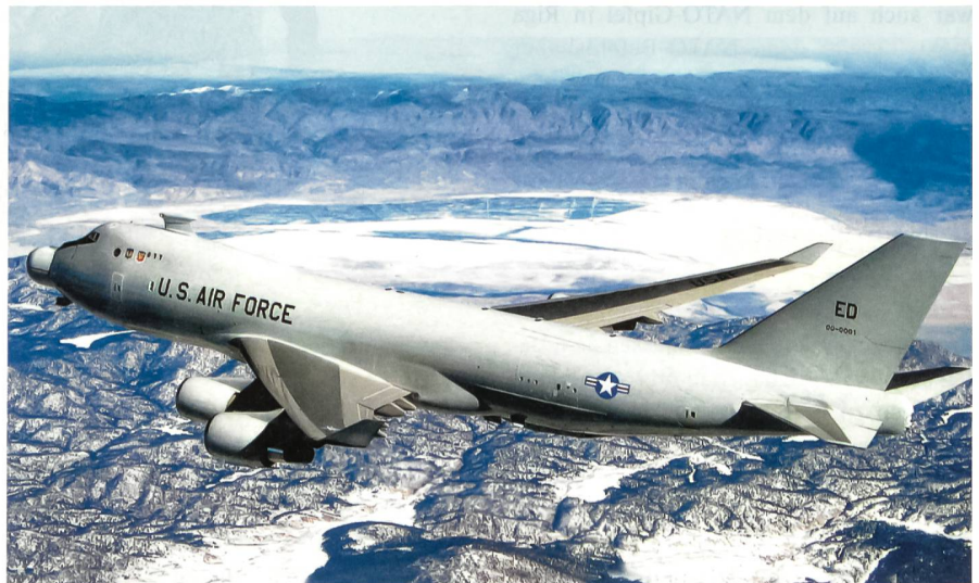
YAL-1, die erste von sieben zum Airborne-Laser umgebauten Boeing 747-400.

Neben der Air Force gehören noch der Rüstungs- und Flugzeugkonzern Lockheed-Martin, die seit 1961 mit der Entwicklung von Lasern vertraute Northrop Grumman Corporation und der Flugzeugbauer Boeing als Konsortialführer zum Airborne-Laser-Konsortium. Boeing entwickelt dabei das Trägerflugzeug, von dem später voraussichtlich sieben Exemplare fliegen sollen. Der