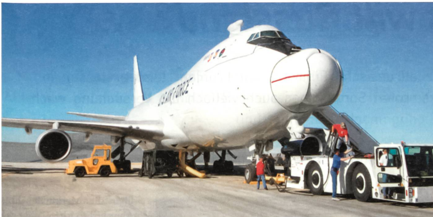
YAL-1 auf der Edwards Air Force Base, einer Luftwaffen- und Testbasis (100 Kilometer nördlich von Los Angeles): «Veränderte Fortschreibung der SDI-Strategie».

Werkzeug und in der intensivsten Form als Waffe selbst für technikgläubige Fans der «Orion»-Zeit atemberaubend. Die grundlegenden Erkenntnisse über den Vorgang der «Lichtverstärkung durch Induzierte Emission» schrieb 1917 Albert Einstein nieder, der sie als «Umkehrung der Absorption» einordnete.