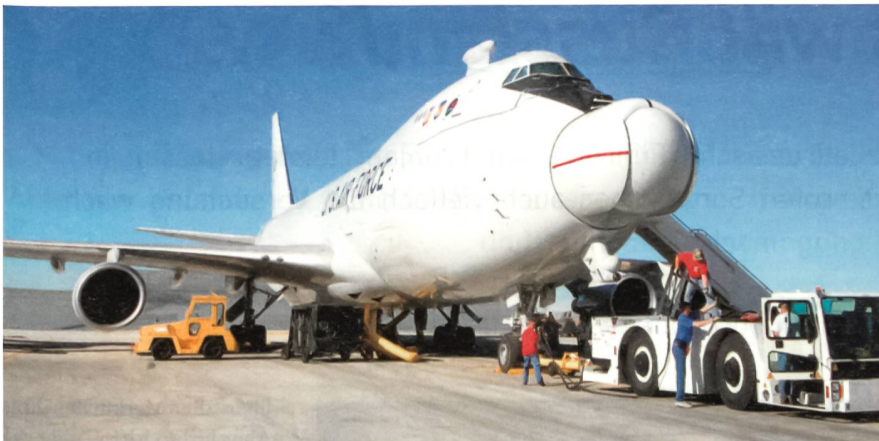
YAL-1 auf der Edwards Air Force Base, einer Luftwaffen- und Testbasis (100 Kilometer nördlich von Los Angeles): «Veränderte Fortschreibung der SDI-Strategie».

Werkzeug und in der intensivsten Form als Waffe selbst für technikgläubige Fans der «Orion»-Zeit atemberaubend. Die grundlegenden Erkenntnisse über den Vorgang der «Lichtverstärkung durch Induzierte Emission» schrieb 1917 Albert Einstein nieder, der sie als «Umkehrung der Absorption» einordnete.