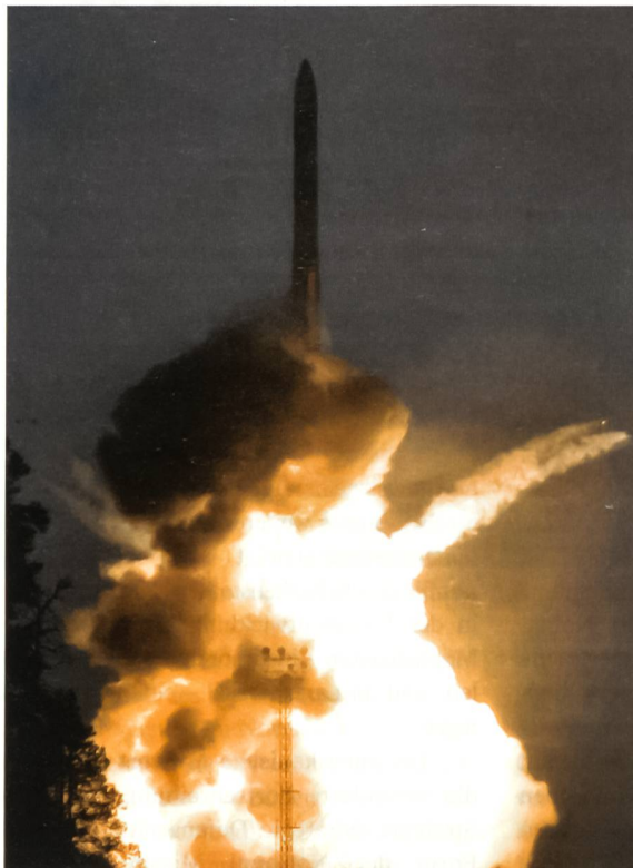
Erprobung einer neuen russischen Interkontinentalrakete.

Vorwand ist das amerikanische Raketenabwehrprogramm, National Missile Defense, dessen erklärter Zweck die Abwehr von Angriffen durch nuklear bestückte ballistische Raketen von neuen, als gefährlich eingestuften Atommächten ist, z.B. Iran oder Nordkorea. Das Angebot der USA an Polen