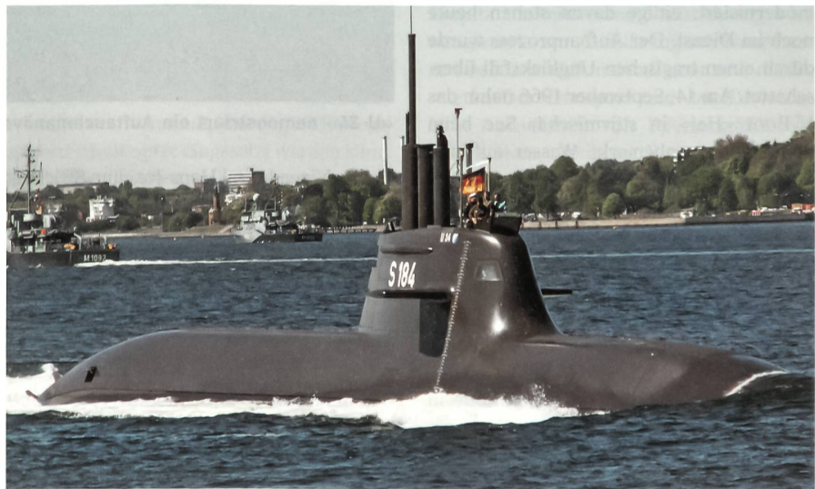
Die «U 34» (S 184) auf der Fahrt in der Kieler Förde.

Erstmals erhielt der Unterseeboot-Krieg eine nachhaltige Bedeutung. Im Mai 1915 versenkte die «U 20» den britischen Passagierdampfer «Lusitania», wobei gegen 1200 Menschen, darunter 120 US-Staatsbürger, ums Leben kamen. Mit diesem schrecklichen Ereignis wurde der Kriegseintritt der USA beschleunigt. Nach der Kapitulation des Deutschen Reiches 1918 hatten die 374 ein-