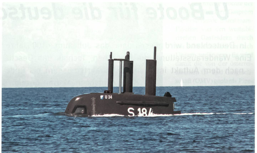
«U 34» demonstriert ein Auftauchmanöver in der Ostsee.

Im Beisein von Staatssekretär Christian Schmidt und des Kommandeurs der