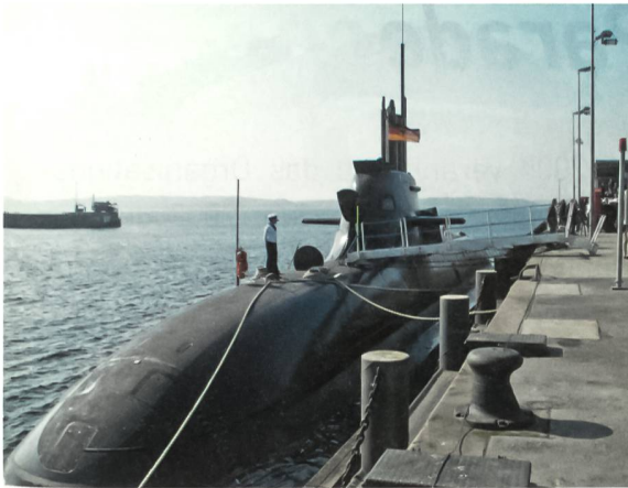
Der Kommandant von «U 32», Kapitänleutnant Tastl, überwacht nach einer Tauchfahrt das Anlegemanöver in Eckernförde.

eigene kleine Kammer, die Kombüse ist gerade mal etwa 2 m 2 gross, und vor Einsatzfahrten hängt überall im Boot an den Decken Proviant, gut verstaut in Netzen.