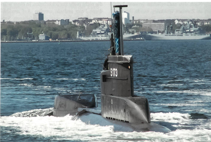
Zum Gedenken erweisen vier U-Boote der deutschen und norwegischen Marine vor dem Denkmal in Möltenort in der Kieler Förde den 35000 gefallenen U-Boot-Fahrern die Ehre, hier das U-Boot «U 24» (S 173), ein Boot der Klasse 206 A.

Der Innenraum der neuen U-Boote ist wesentlich freundlicher und auch etwas geräumiger als jener der Klasse 206 A. Dank umfassender Automatisierung zählt die Besatzung bloss 28 Offiziere und Unteroffiziere. Diese dürfen über etwas mehr Komfort verfügen, aber eng und spartanisch ist es allemal. Nur der Kommandant hat eine