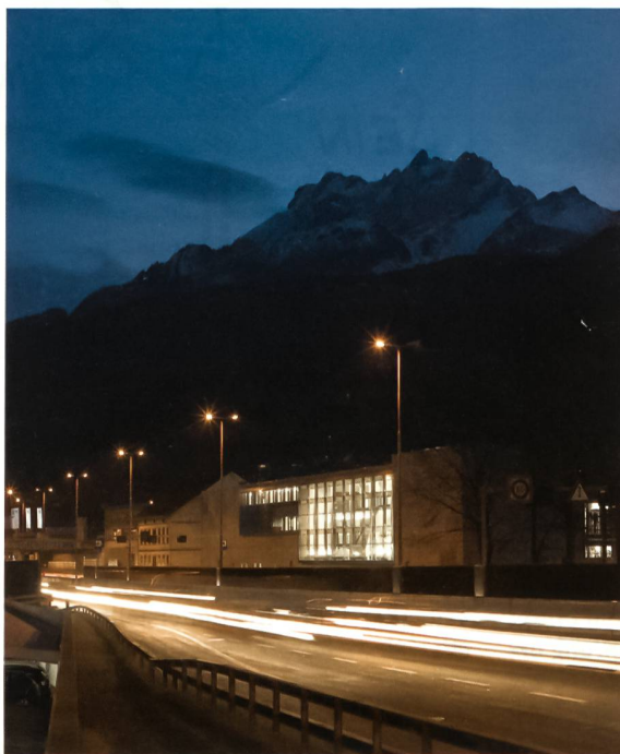
Neues Ausbildungsgebäude der Generalstabsschule.

Die Pilotanlage erarbeitet an der Schnittstelle zwischen Taktik und Technik, unterstützt durch E-Doc, anwenderorientierte Lösungen im Rahmen der Systemanwendung und -ausbildung sowie des Szenario-