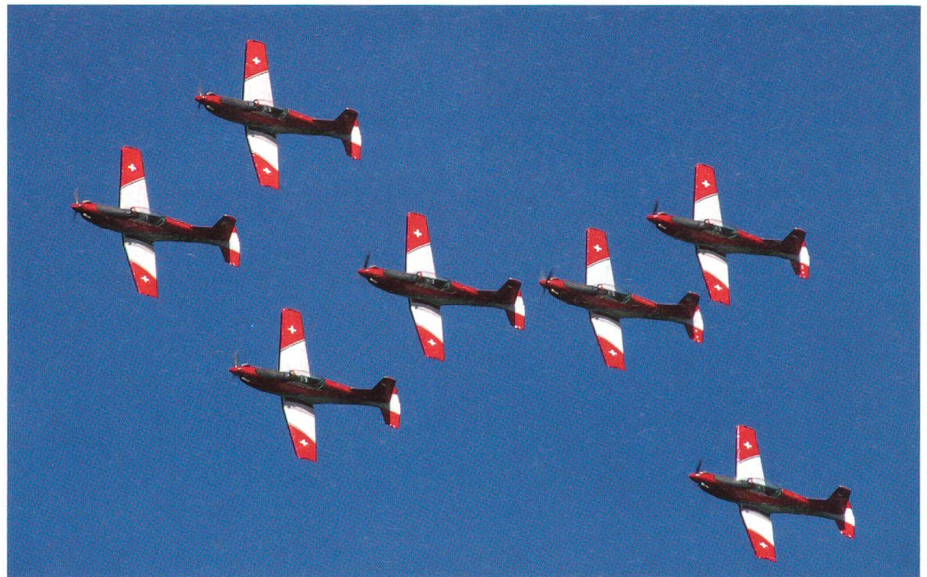
Das PC-7-Team mit sieben Maschinen in Aktion.