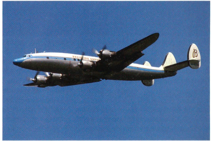
Vorbeiflug der Super Constellation.