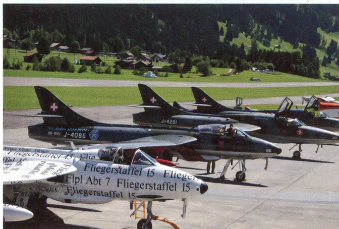
Nostalgie – die Hunter-Linie.