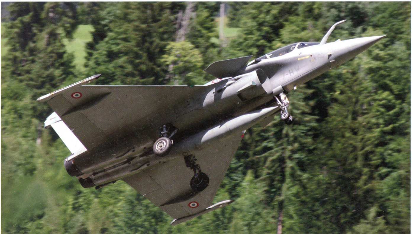
Rafale aus Frankreich – Superstar des Fliegermeetings von St. Stefan.