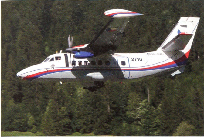
Let 410 der tschechischen Luftwaffe.