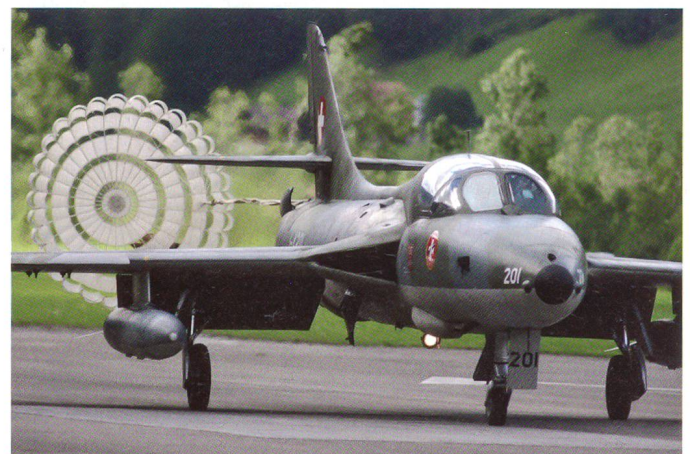
Hunter mit Bremsfallschirm.