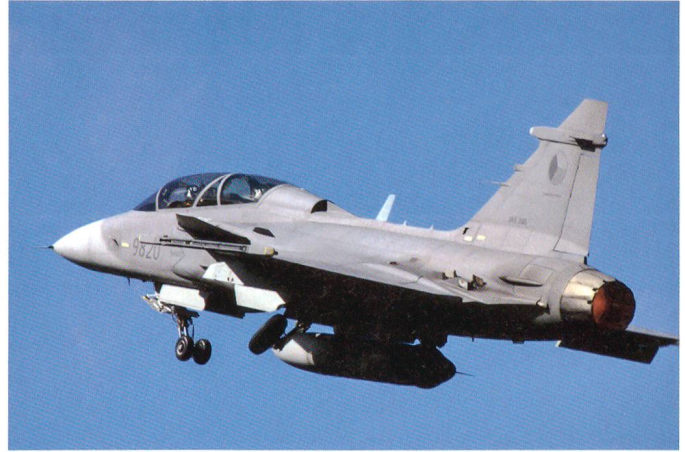
Ein tschechischer Gripen nach dem Start.