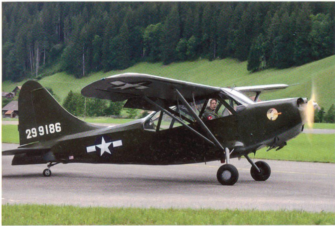
Veteran aus den USA: Stinson L-5.