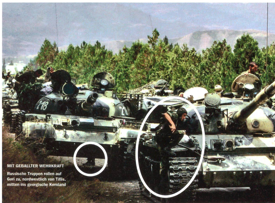
MIT GEBALLTER WEHRKRAFT Russische Truppen rollen auf Gori zu, nordwestlich von Tiflis, mitten ins georgische Kernland