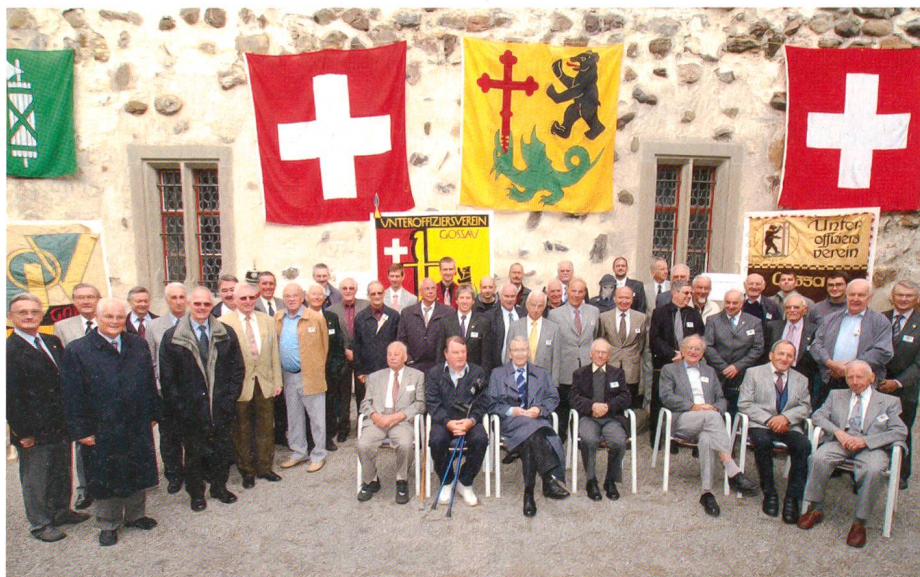
Die Festgemeinde vor ihren Fahnen.