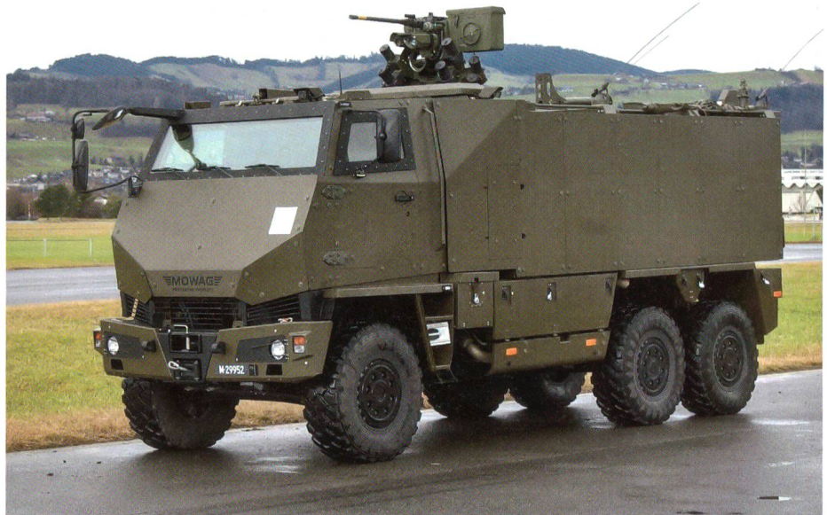
Die Infanterie braucht dringend Transportfahrzeuge.

Gleiches gilt für die zweite grosse Position im Rüstungsprogramm. Die Firma MOWAG trifft in Kreuzlingen schon die Vorbereitungen, damit sie ab 2009 das Geschützte Mannschaftstransportfahrzeug