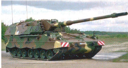
Griechische Panzerhaubitze 2000.

Die griechischen Streitkräfte sind daran, die letzten Details zum Kauf von 12 Panzerhaubitzen 2000 aus Überbeständen der Bundeswehr zu kaufen. Der Paketpreis, welcher ne-