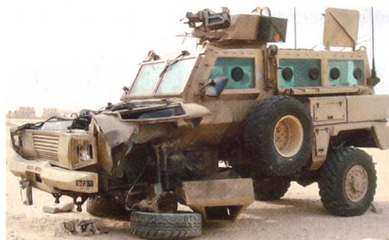
Fahrzeug des Typs RG-31 im Irak nach der Explosion einer Sprengladung – der Personenraum ist intakt geblieben.

Die spanischen Streitkräfte haben dem Hersteller General Dynamics Santa Barbara Sistemas einen Auftrag über knapp 65 Mio. € zur Lieferung von 100 minengeschützten Fahrzeugen des Typs RG-31 Mk5E gegeben. Die Bestellung beinhaltet 85 gepanzerte