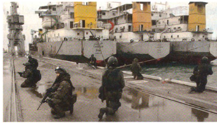
Polnische Spezialeinheit «GROM» beim Sichern des Hafens Umm Qasr.

amerikanischen Humvees unterwegs waren. Trotzdem wird das polnische Verteidigungsministerium in den nächsten Wochen die Ausschreibung zur Beschaffung von 180 leichtgepanzerten Mannschaftstransportern lancieren, welche bei einem Maximalgewicht von 10 Tonnen bis zu fünf Soldaten geschützt vor Minen und Direktbeschuss transportieren können.