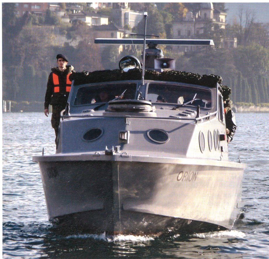
Patrouillenboot auf dem Luganer See.

Beim Standort Cornaredo wurden schwergewichtig Demonstrationen der Panzertruppen vorgeführt. So zeigten die Panzertruppen den Meccano beim Über-