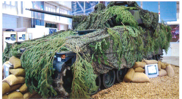
Gut getarnter Schützenpanzer.