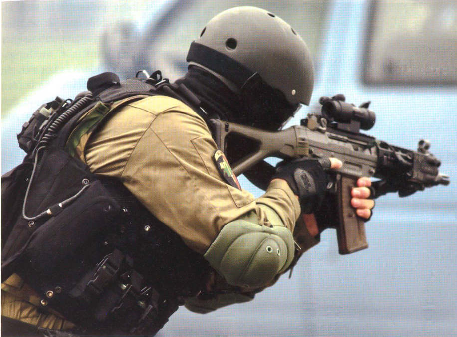
Militärpolizei zeigt ihr Können.