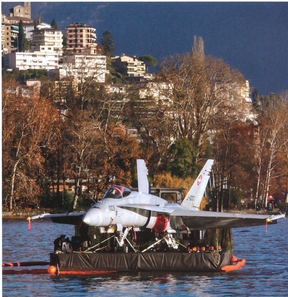
Der Flugzeugträger auf dem See.

queren eines Gewässers vom Eintreffen der Aufklärer, über die Sicherung der Panzergrenadiere und der Beseitigung von Minen und Hindernissen durch die Panzersappeure bis hin zum Stoss der Kampfpanzer und Panzergrenadiere über die schnell verlegte Brücke des Brückenpanzer 68/88.