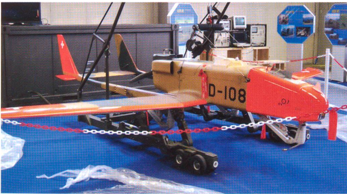
Drohne als Ausstellungsobjekt.