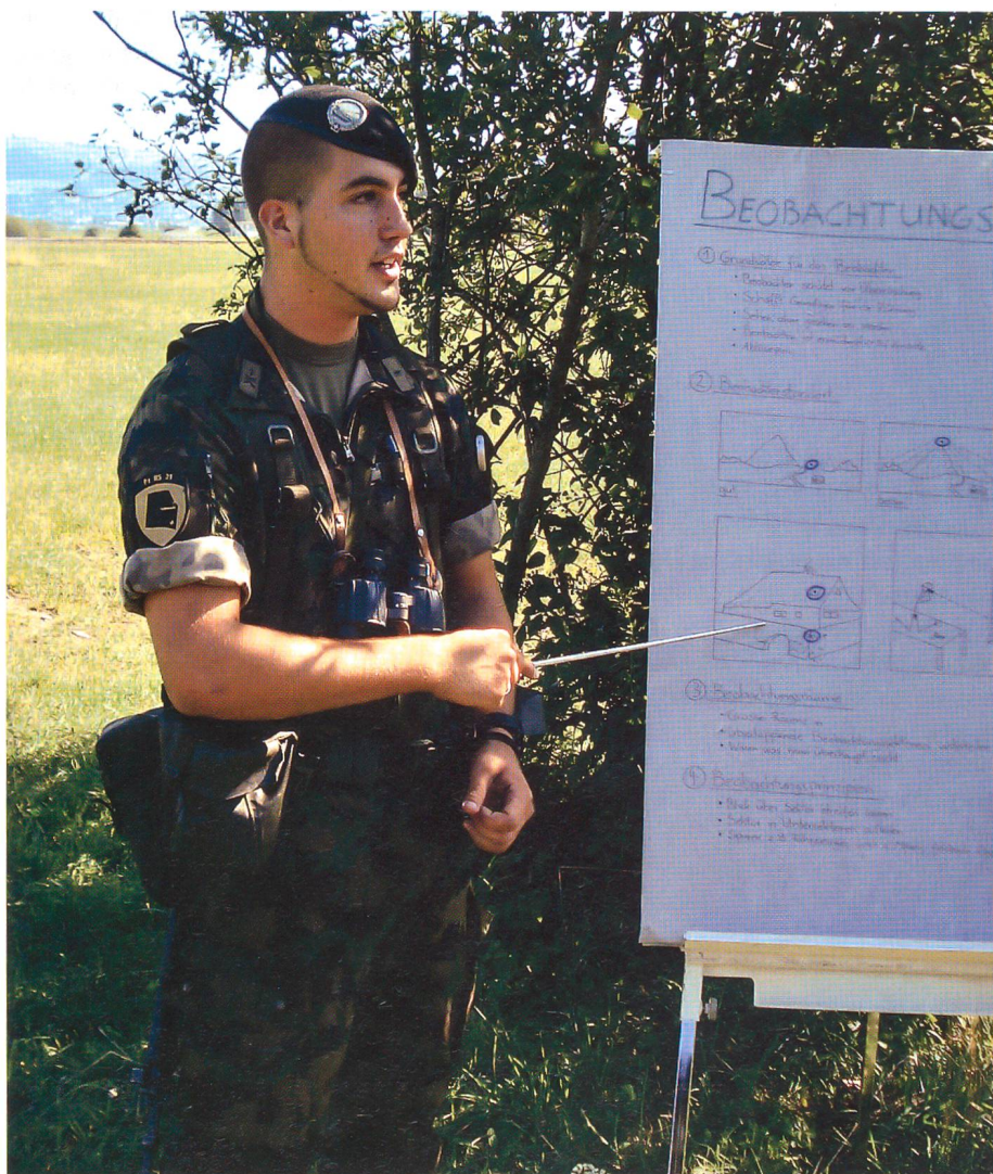
Instruktion im Gelände.

Die Gruppenführer, hauptsächlich Wachtmeister und vereinzelt Hauptfeldweibel, bereiten ihre Lektionen vor und bilden die Rekruten in allen denkbaren Themen aus. Es wird an den Gewehren manipuliert, sie werden zerlegt und wieder