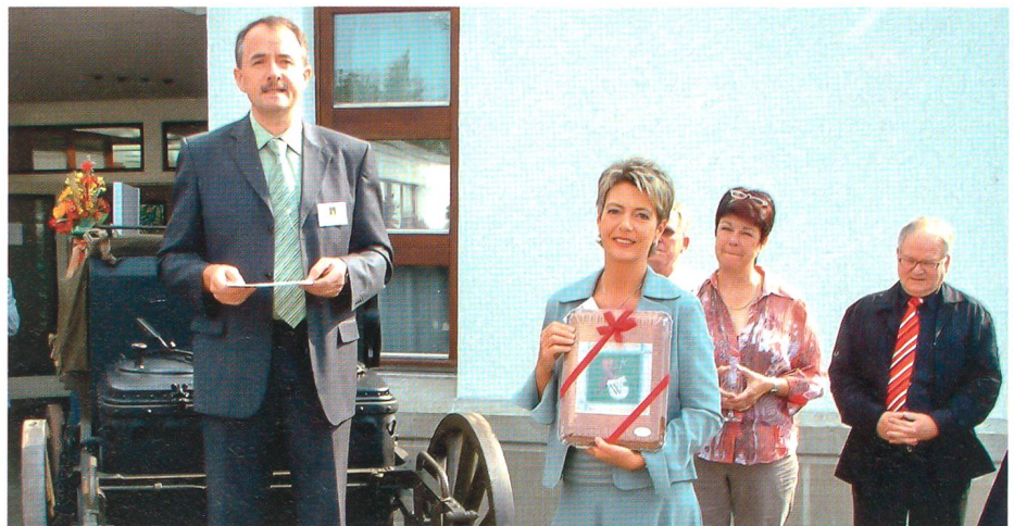
Die St. Galler Regierungsrätin Karin Keller-Sutter (Mitte mit Geschenk) überbrachte die Glückwünsche der Kantonsregierung.