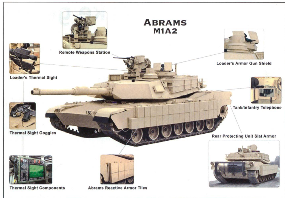
Das Tank Urban Survivability Kit wurde nach den Erfahrungen im Irak entwickelt.

auf entsprechenden Übungsanlagen systematisch trainiert werden.