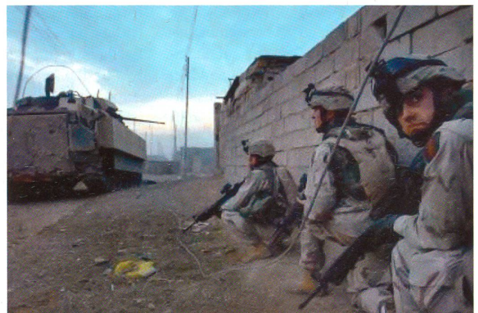
... und abgesessener Infanterie war der Schlüssel zum Erfolg von TF 2-2.