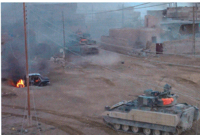
Die enge Zusammenarbeit zwischen Kampfpanzern, Kampfschützenpanzern...