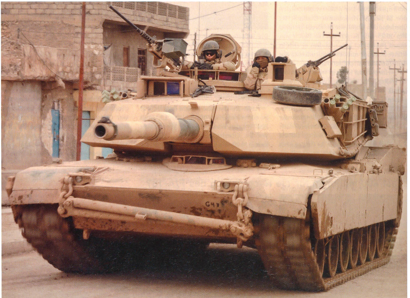
Ein M1A2 in den Strassen einer irakischen Stadt. Kommandant und Lader halten ihre persönliche Waffe griffbereit!

Einzelne Armeen (Beispiel Kanada und Deutschland) beschaffen sogar neue