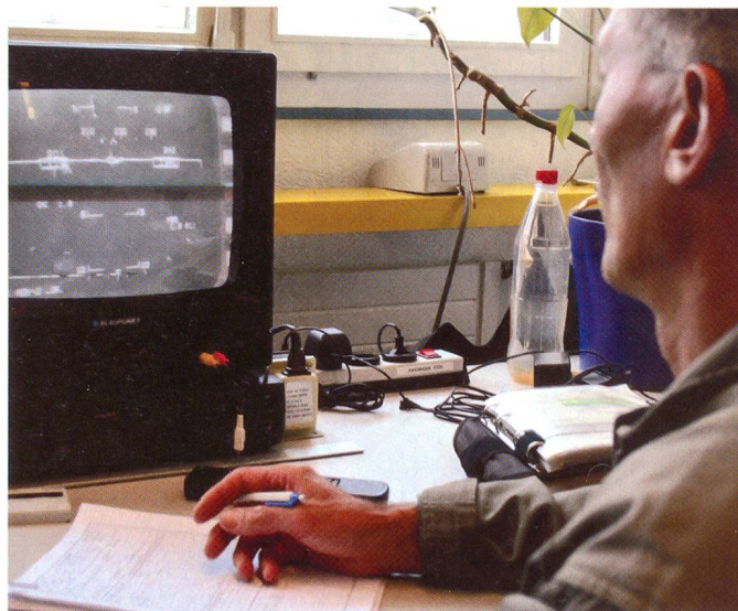
Auswertung: Nach dem Werkflug wird anhand der gesammelten Daten erhoben, was für ein Reparaturbedarf besteht.

Ablauf ist eigentlich immer der gleiche: Was für ein Problem hat das Flugzeug? Wie kann der Werkpilot helfen? Grundlage der Vorbereitung ist immer das Protokoll des Flugzeugs und die Absprache mit der Maintenance Crew.