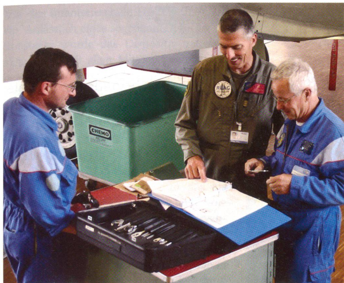
Ein Werkpilot arbeitet eng mit dem Hallenchef und den Mechanikern und Avionikern des Flugplatzes zusammen.