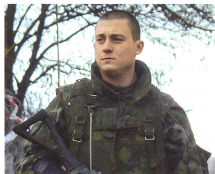
Entschlossen auf dem Posten.