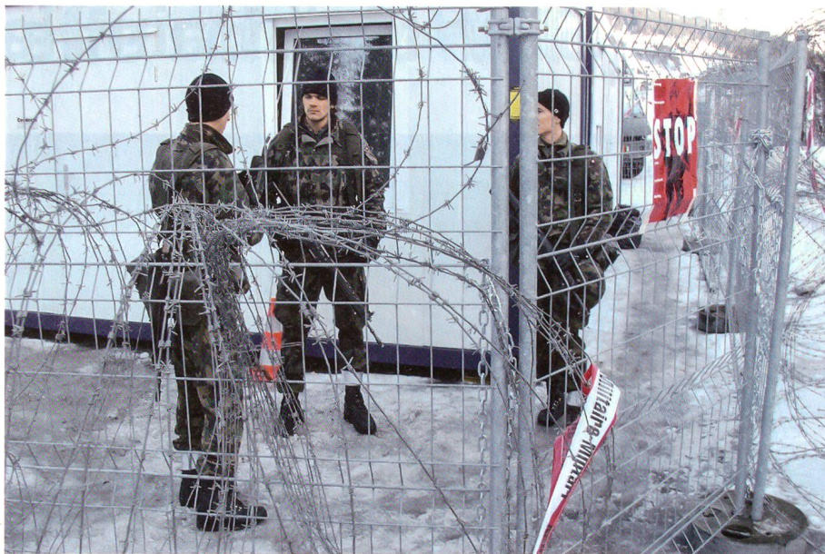
Objekt gesichert mit Stacheldraht, Absperrgitter und einsatzbereiten Soldaten.

Für den Kommandanten des Inf Bat 70, Oberstleutnant im Generalstab Romeo Fritz, verläuft der Einsatz erfolgreich. Er ist überzeugt, dass die Armee einen wesentlichen Beitrag zum Erfolg des WEF leistet.