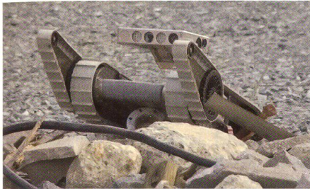
Small Unmanned Ground Vehicle (SUGV).

Die US Army drängt im Rahmen des Projektes «Future Combat Systems» auf die Auslieferung von Robotersystemen. So soll einerseits eine neue kleinere aber trotzdem leistungsfähige Überwachungsdrohne getestet werden und andererseits ein kleines unbemanntes Bodenfahrzeug zu Aufklä-