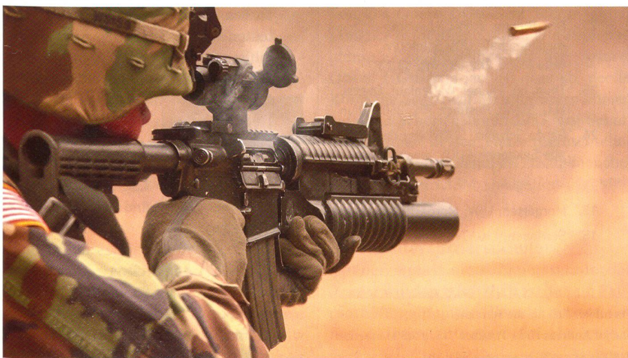
Das Colt M4 soll das M16 als Hauptbewaffnung der US-Bodentruppen ablösen.

Die US Army plant, die M4-Variante des altgedienten M16 als Hauptbewaffnung für ihre Bodentruppen einzuführen. Dabei soll eine neue kürzere und handlichere Version speziell für Einsätze auf und ab Fahrzeugen entwickelt werden. Trotzdem gibt es kritische Stimmen, welche dem System mangelnde Zuverlässigkeit in staubigen und sandigen Gegenden wie insbesondere Afghanistan oder Irak vorwerfen, und ein Modell mit einem geschlossenen Gassystem vorziehen würden. Weiter wurden bei verschiedenen Spezialeinheiten Modelle des SCAR eingeführt, da aufgrund der modula-