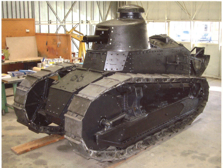
So präsentiert sich der noch motorlose «Renault FT 17».

2006 zeigte sich, dass die vielen Jahre im Freien dem Fahrzeug arg zugesetzt hatten. Als damaliger Kommandant des Lehrverbandes Panzer ordnete ich an, den Panzer in der Werkstatt komplett zu zerlegen. Bei diesen und weiteren Arbeiten zeigte sich: