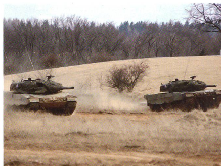
Leoparden im Angriff.