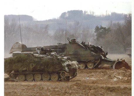
Hindernis wird geräumt.