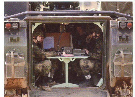
Feuerleitstelle der Artillerie.