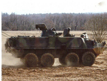
Radschützenpanzer in Aktion.