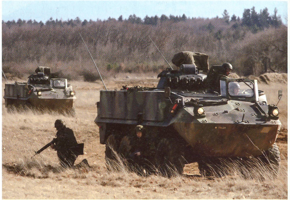
Abgesehen im Kampf.