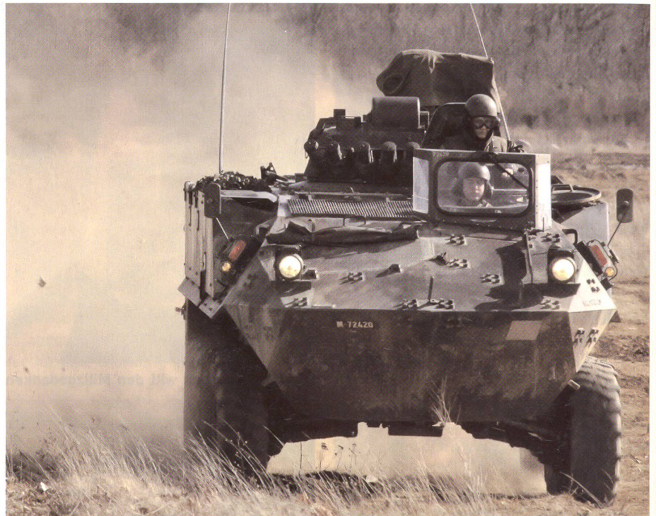
Bière, 26. Februar 2008: Volle Fahrt voraus.

Brigadier Leuenberger präsentierte seinen Lehrverband. Dieser stellt die Grundausbildung für die Panzertruppen und die Artillerie sicher. Anschaulich führte