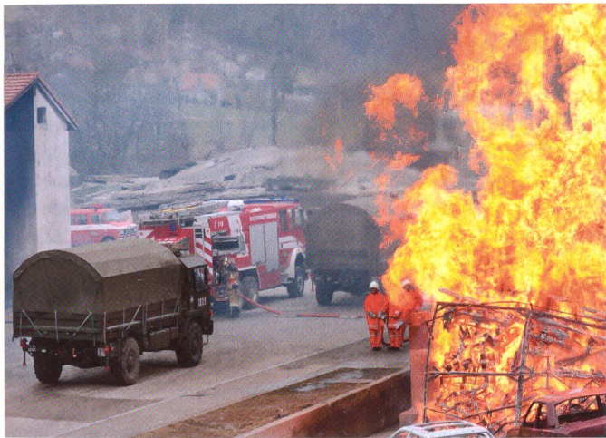
Es brennt lichterloh.