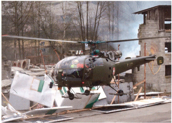
Helikopter greift ein.