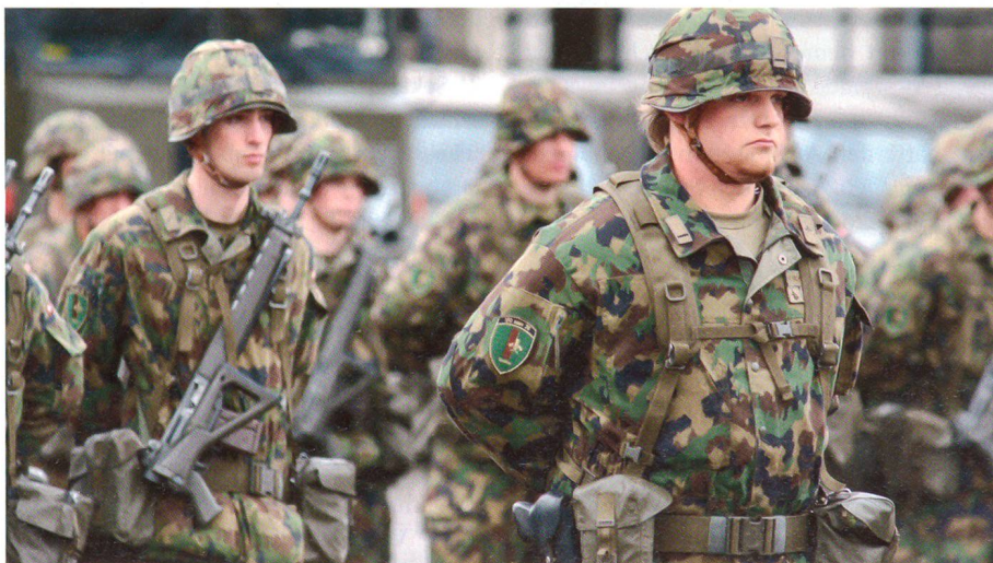
Wangen an der Aare, 27. Februar 2008: Bereit zum Einsatz.

Während des anschliessenden Mittagessens in der Kasernen-Mensa tauschten