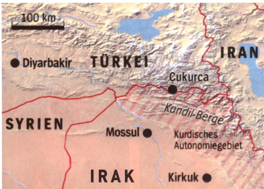
Das Grenzland von Irak und Türkei. Rot schraffiert das irakische Kurdengebiet.