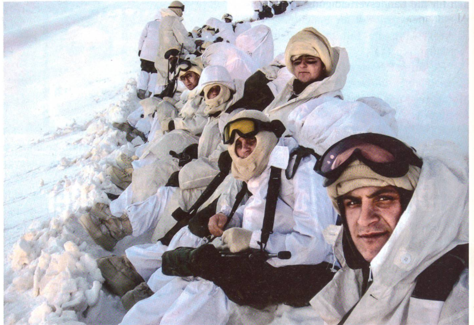
Türkische Soldaten im Nordirak. Die Türkei will ständige Stützpunkte ausbauen.