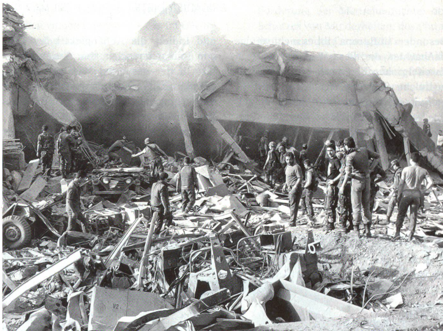
Beirut, 23. Oktober 1983: Bei Mughnijas Anschlägen mit Autobomben fanden 68 französische Soldaten und 241 amerikanische Marine-Infanteristen den Tod.

zu verändern, dass er vor seinen Jägern unerkannt blieb. Am 12. Juni 2006 ordnete er die Entführung der israelischen Soldaten Ehud Goldwasser und Eldad Regev an, was dann den Sommerkrieg auslöste.