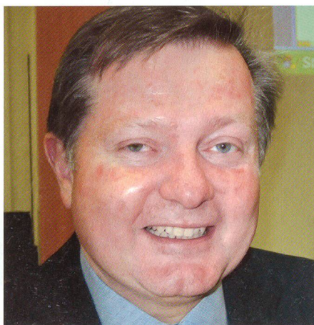
Schmidl: «Nicht immer hat die Politik das Bundesheer voll unterstützt.»