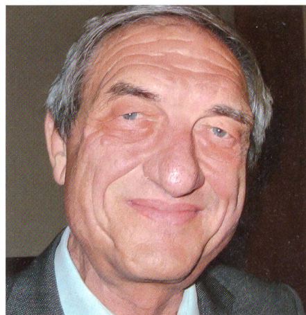
Fuhrer: «Die Schweiz hat ein Plus im Wappen, Österreich ein Minus.»