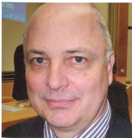
Rauchensteiner: «Der Anschluss von 1938 war Annexion, nicht Okkupation.»

In den 1990er-Jahren erwog Österreich den Beitritt zur NATO: «Aber das scheiterte am mangelnden politischen Konsens. Die Regierungsparteien SPÖ und ÖVP hatten dazu zu grosse Differenzen.» fö. +