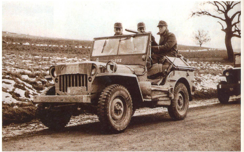
Ungarn-Krise im Oktober 1956: Grenzpatrouille im Jeep.

In Wien empfand das Volk den Vertrag als Katastrophe. Man redete vom «Staat, den keiner wollte». Staat und Staatsvolk fanden nicht zueinander. 1929 brach die