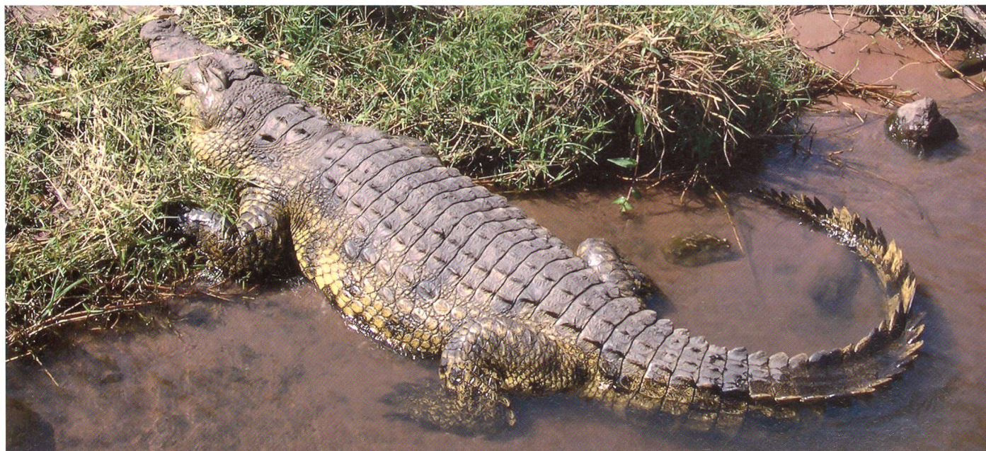
Füttert nicht das Krokodil!

Bereits in den frühen Neunzigerjahren, nach der strategischen Wende in Europa, machten die Nachrichtendienste darauf aufmerksam, dass die Gefahr der Unter-