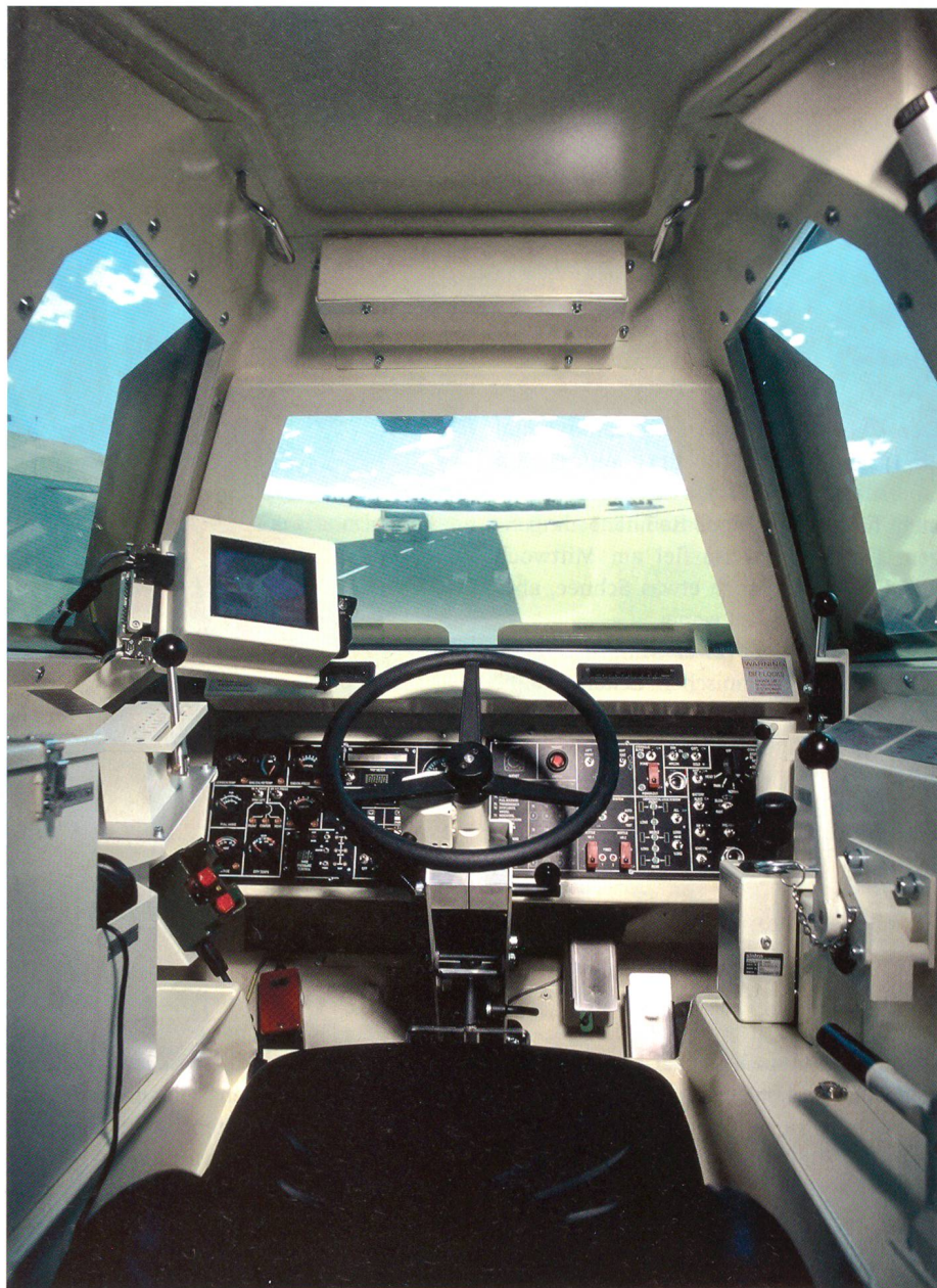
Ein moderner Fahrschulsimulator der RUAG.

In Altdorf wurde 2005 durch ein Unwetter die RUAG-Fabrik weggeschwemmt. Heute werden dort nach dem Wiederaufbau präzise Grossbauteile produziert. +