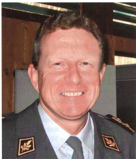
Divisionär Ulrich Zwygart.

Wie der Einladung zur Verabschiedung von Divisionär Ulrich Zwygart als Kommandant der Höheren Kaderausbildung der Armee (HKA) zu entnehmen ist, wird ein Divisionär-Ulrich-Zwygart-Fonds gegründet. Unter dem Stichwort Veranlassung heisst es: «Die Armee hat 2004 mit der HKA die