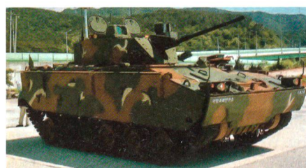
Koreanischer Kampfschützenpanzer K-21.

Die südkoreanischen Streitkräfte bestätigen die Beschaffung von fünfhundert Kampfschützenpanzern des lokalen und neuentwickelten Typs K-21. Nach sieben Jahren Entwicklungszeit sollen die ersten Fahrzeuge im Jahr 2009 der Truppe übergeben werden. Der K-21 ist mit einer vollstabilisierten 40-mm-Boforskanone, einem 7,62-mm-MG und einem Werfer für Panzerabwehrflugkörper bewaffnet. Das vollamphibische Fahrzeug verfügt über 3 Besatzungsmitglieder, kann 9 Infanteristen mitführen und erreicht an Land eine Geschwindigkeit von 70 km/h und im Wasser knapp 8 km/h. Patrick Nyfeler