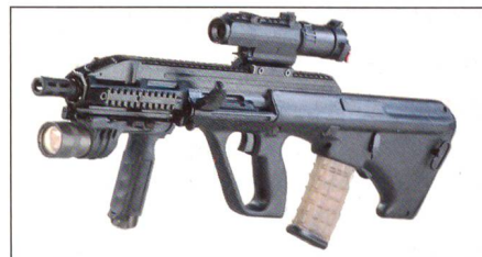
Steyr AUG A3.

Die neuseeländischen Streitkräfte haben mit einem Projekt zur Aufrüstung ihrer Infanteriewaffen begonnen. Dabei wird einerseits ein Teil der F88 Steyr-Sturmgewehre mit neuen optischen Zielhilfen ausgerüstet sowie neue und effektivere Munition im Kaliber 5,56x45 mm getestet. Mit Hilfe dieser Verbesserungen soll das Sturmgewehr noch weitere zehn Jahre bei den Streitkräften eingesetzt werden. Daneben muss ein Ersatz für das leichte MG Minimi sowie für die eingesetzten Pistolen SIG Sauer gesucht werden, da beide Waffensysteme bald das Ende ihrer Lebensdauer er-