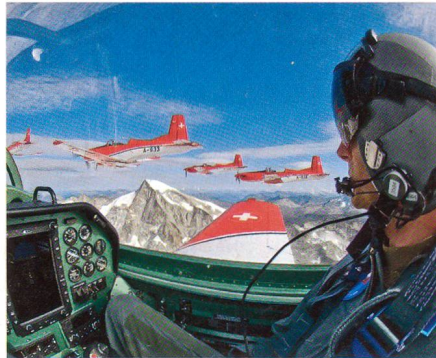
Blick ins Cockpit über die Schulter eines Piloten.