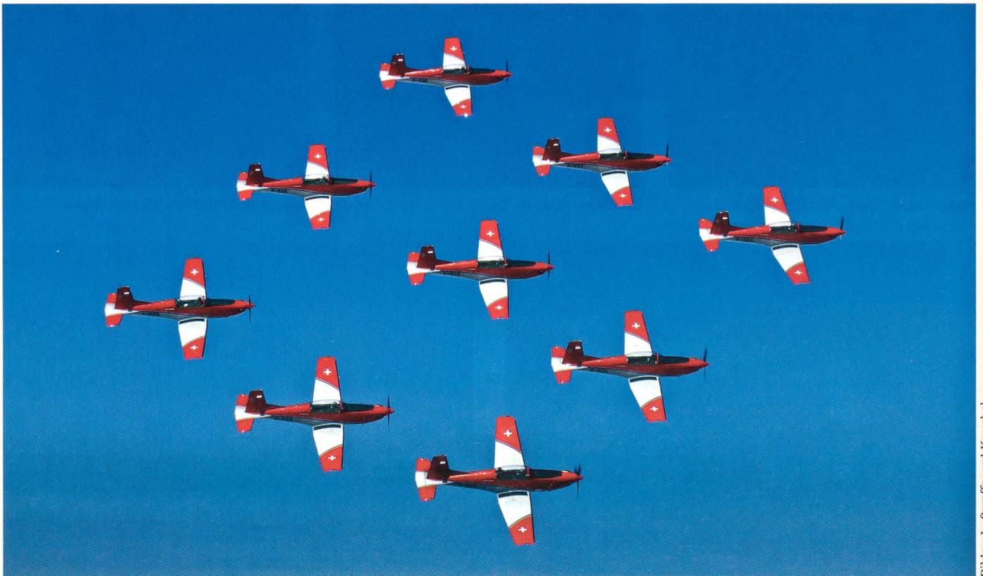
Kunstflug von neun Piloten in Perfektion.