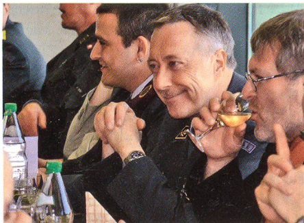
Gut gelaunter Ehrengast.

Die Veränderungen in Gesellschaft, Politik und Armee prägen auch die Lage des