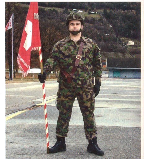
Schwarze Handschuhe sind vorgeschrieben.

Der Leser irrt. Die schwarzen Handschuhe sind absolut ordonnanzgemäss, und die braunen wären es nicht mehr. Im neuen Fahnenreglement der Armee heisst es unter Ziffer 2.3. (Träger des Feldzeichens) un-