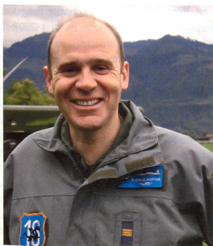
Hurter auf dem Feldflugplatz Tuggen.

Am 26. Mai 2008 genehmigte das Büro des Nationalrates die Schaffung einer Subkommission «Tiger-F-5-Ersatzbeschaffung». Zum Präsidenten wurde der Schaffhauser Nationalrat Thomas Hurter gewählt. Hurter ist von Beruf Pilot bei der SWISS. In der Miliz fliegt er den PC-6.