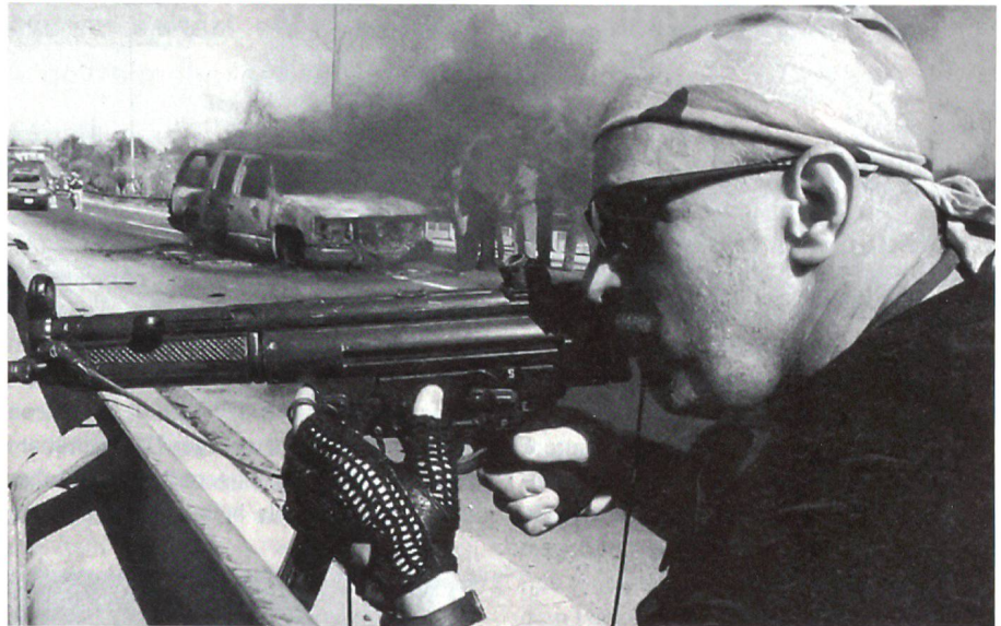
Söldner im Irak. Sie tragen keine Uniform und erscheinen in keiner Statistik.

Blackwater ist die grösste amerikanische Privatsicherheitsunternehmung und nicht unbestritten. Ihre Einsätze im Irak geben militärisch und politisch immer wieder