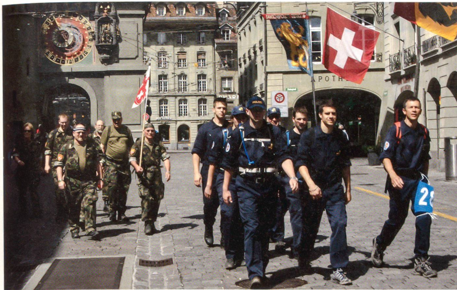
Durch die malerische Altstadt von Bern.