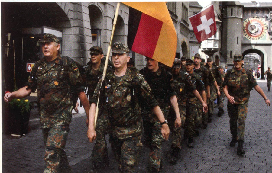
Marschgruppe der Bundeswehr in Schritt und Tritt.