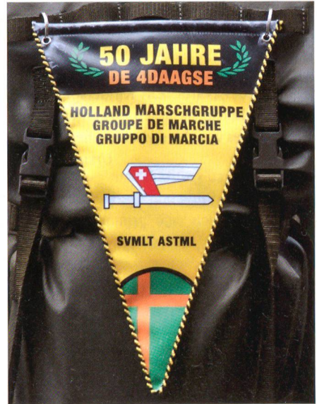
Darf mit Stolz getragen werden.