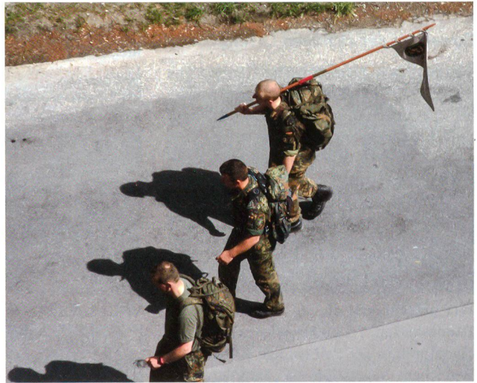
Kameraden aus Deutschland.