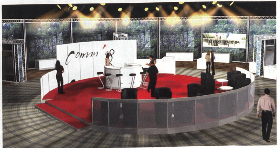
Die Besucher erwartet eine attraktive Ausstellung an der Comm'08 in Frauenfeld.

Auch die militärische Ausbildung im Bereich der Führungsunterstützung in den Lehrverbänden wird sich anschaulich darstellen. Insgesamt entsteht so ein umfassendes Bild eines Armeebereiches, der in der Öffentlichkeit wenig bekannt ist. Herzstück der Ausstellung ist das «FU-Miniature» in der Halle 3. Dort wird den Besuchern in einer multimedialen Präsentation gezeigt, was